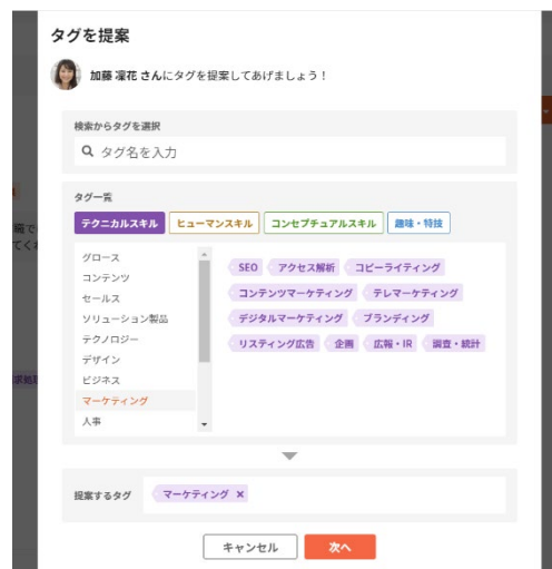
図 2: タグ付け提案イメージ

仕事をする中で、素晴らしいと感じた同僚のスキルに対して、スキルのタグづけ提案が可能です。自分で登録したものだけでなく、周囲に認められたスキルが可視化されることで、認め合いの文化を醸成します。