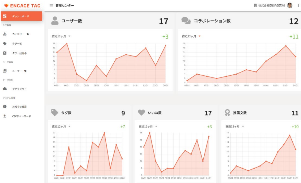
図 5: 管理者専用画面イメージ

「ENGAGE TAG®」上でのタグの交換状況や「いいね」付与の状況などのコミュニケーションデータを個別に数値化・グラフ化することにより、従業員毎のスキルや活動状況、組織の状態を管理者専用の WEB 画面で把握することができます。