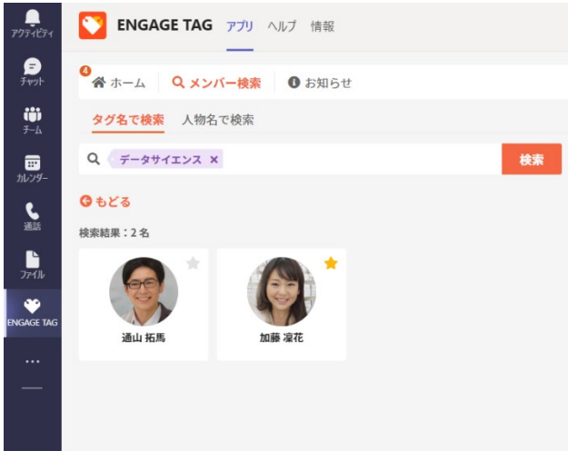
図 3: タグによる検索機能

設定したタグに基づいた柔軟な社員検索に加え、複数のスキルを掛け合わせた検索も可能です。さらに、ネットワーク表示機能を使えば、検索結果の相手と関連するメンバーが表示できるため、新たなプロジェクト発足時のチーム組成検討に役立てたり、従業員の人材ネットワークの把握などに活用したりすることができます。