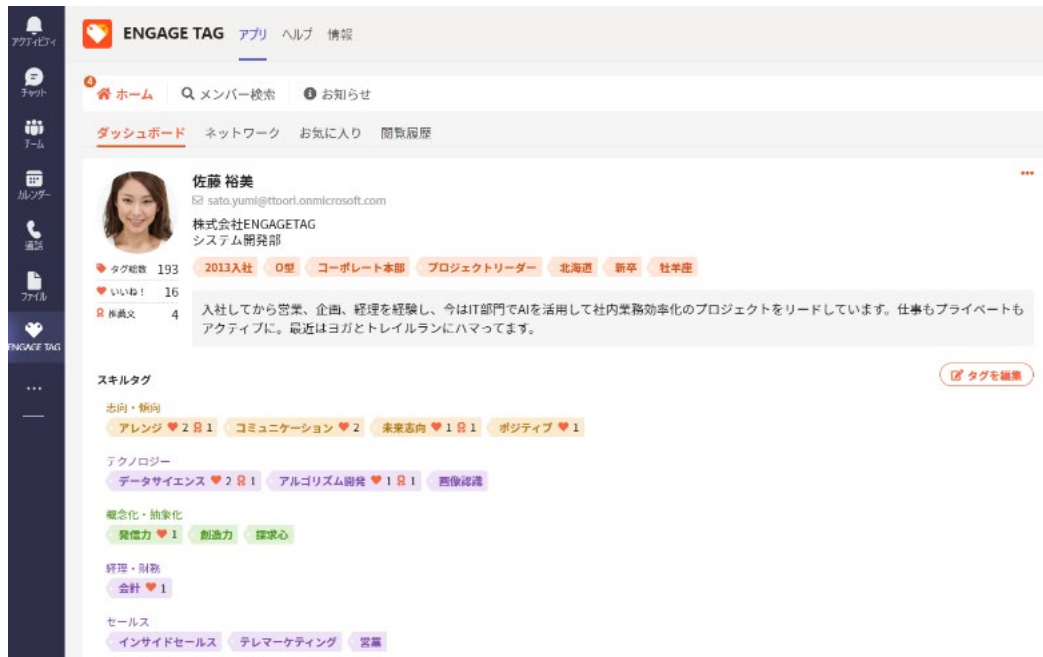
図 1: タグ付け機能イメージ

プロフィール作成時には、所属部署やビジネススキルといった一般的な項目だけでなく、趣味・特技や興味・関心など、さまざまな情報を柔軟に”タグ”化して登録することができます。また社員のスキルを「テクニカル(技術)」「ヒューマン(人柄)」「コンセプチュアル(思考)」と3つのカテゴリーで分類することで、人材ポートフォリオとして可視化することができます。