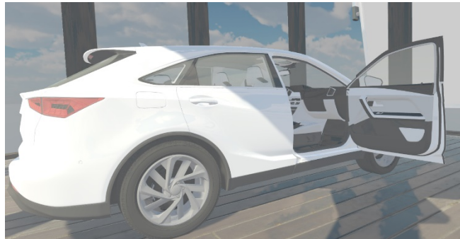
図:背景入れ替え時のイメージ

3D モデリングされた背景はもちろん、撮影した 360 度の静止画/動画を背景として利用することもでき、シチュエーションに応じた空間の再現が可能です。